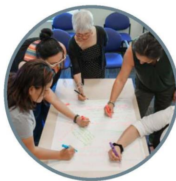
Data & Pagsusuri